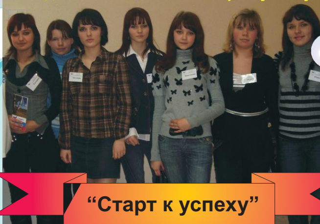
"Старт к успеху"