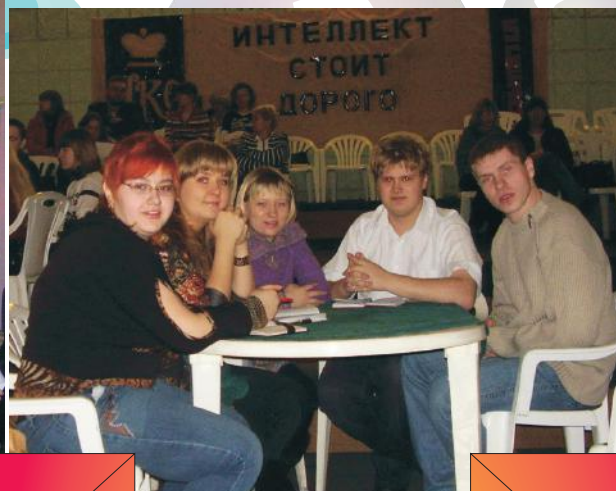
Победа в играх клуба "Что? Где? Когда?"