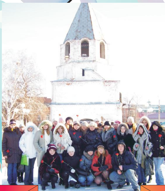
Наш долг - память