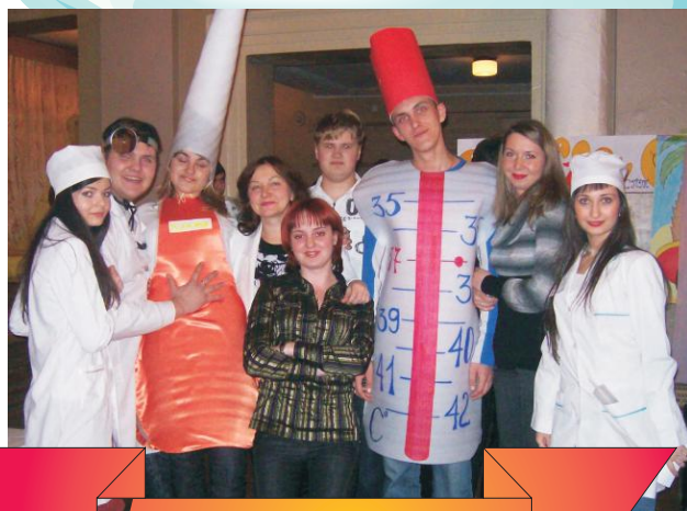
Студенческий бал "Татьянин день"