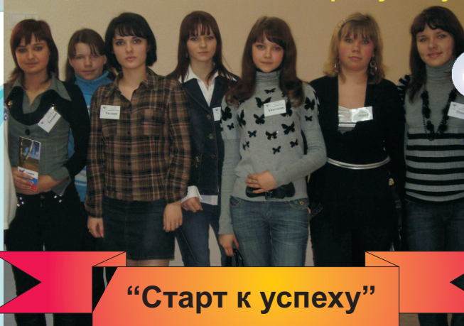
"Старт к успеху"