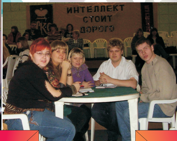
Победа в играх клуба "Что? Где? Когда?"