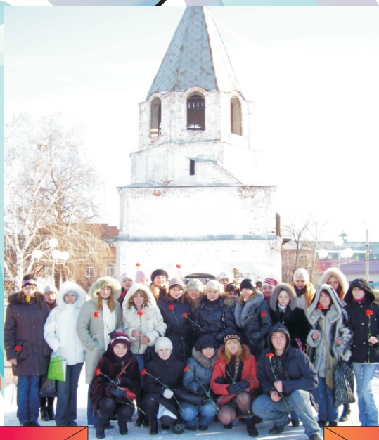
Наш долг - память