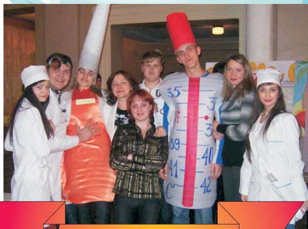
Студенческий бал "Татьянин день"