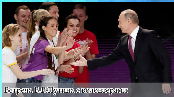
Встреча В.В.Путина с волонтерами