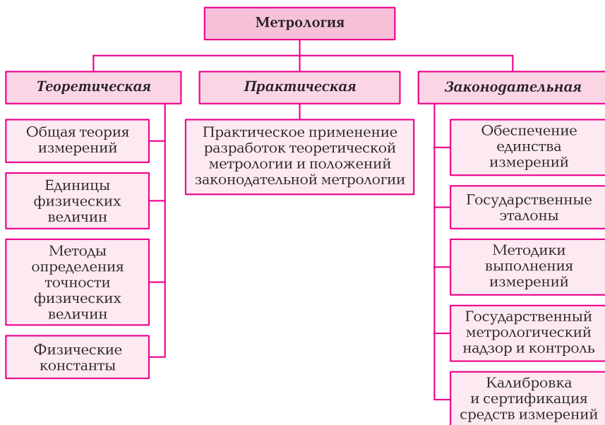
Рис. 1.1. Структурная схема метрологии

метрология включает совокупность взаимообусловленных правил и норм для обеспечения единства измерений.