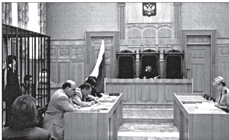
Рис. 1. Зал судебного заседания. Участники судебного процесса: судья, прокурор, адвокат, подсудимый

Судьями являются лица, наделенные в конституционном порядке полномочиями осуществлять правосудие и исполняющие свои обязанности на профессиональной основе (рис. 1).