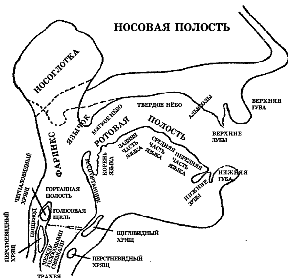
Схема речевого аппарата человека

Органы речи, изображенные на схеме, по-разному участвуют в образовании звуков: одни активны, другие пассивны, различна и их функция.