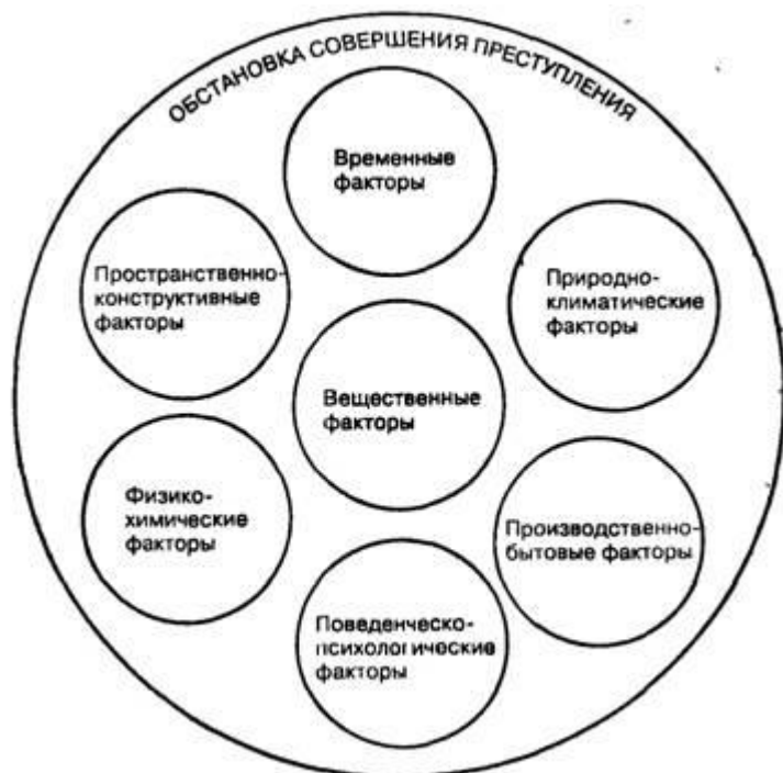
Рис. 2. Структура обстановки совершения преступления

Для ее уяснения большое значение имеет модальная информация из самых разных носителей и источников.