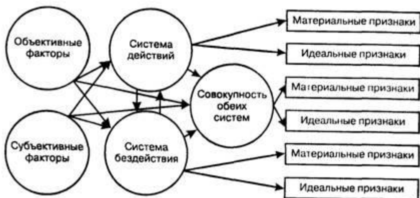
Рис. 1. Схема системного понимания способа совершения преступления.

Под способом совершения преступления в криминалистическом смысле целесообразно понимать объективно и субъективно обусловленную систему поведения субъекта до, в момент и после совершения преступления, оставляющую различного рода характерные следы вовне, позволяющие с помощью криминалистических приемов и средств получить представление о сути происшедшего, своеобразии преступного поведения правонарушителя, его отдельных личностных данных и соответственно определить наиболее оптимальные методы решения задач раскрытия преступления (рис. 1).